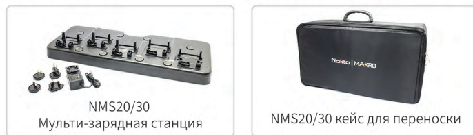
NMS20/30 Мульти-зарядная станция