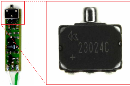
Габариты микрофона: 5.56 x 3.98 x 2.21 мм

SENSITIVITY IN dB RELATIVE TO 1.0 VOLT/0.1 Pa (N/M 2 ) FOR CONDITIONS SHOWN BELOW.