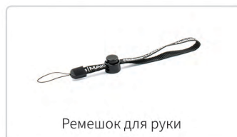
Ремешок для руки