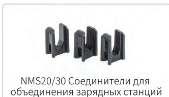
NMS20/30 Соединители для объединения зарядных станций