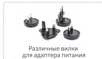
Различные вилки для адаптера питания