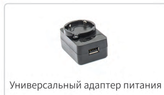
Универсальный адаптер питания