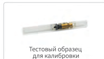
Тестовый образец для калибровки