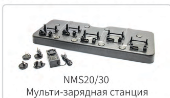
NMS20/30 Мульти-зарядная станция