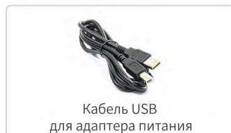
Кабель USB для адаптера питания