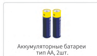
Аккумуляторные батареи тип AA, 2шт.