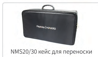
NMS20/30 кейс для переноски